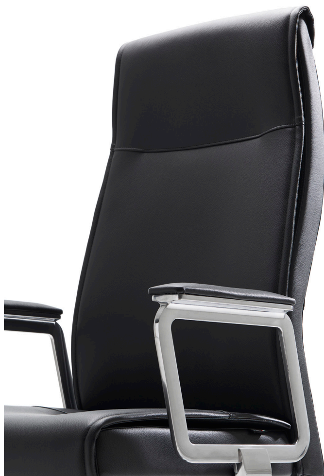
13FP32 MAEVA EXECUTIVE ARMCHAIR