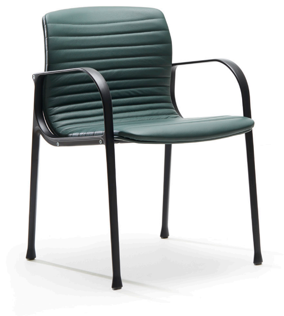
13FP05 UNION GUEST CHAIR