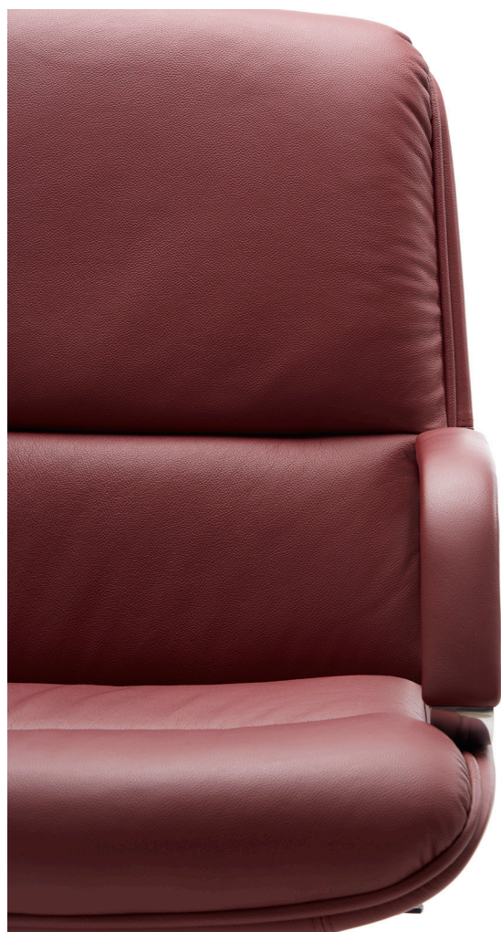
13EP34 KIRUNA EXECUTIVE ARMCHAIR