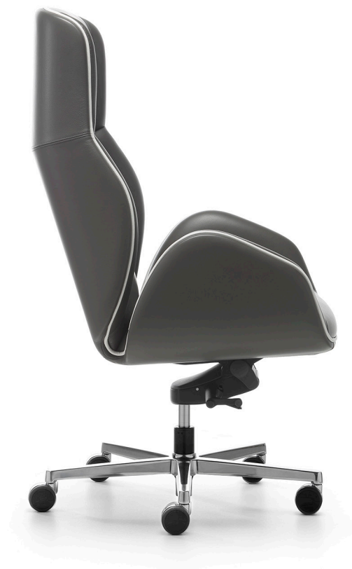
13EP11 SUONI EXECUTIVE ARMCHAIR